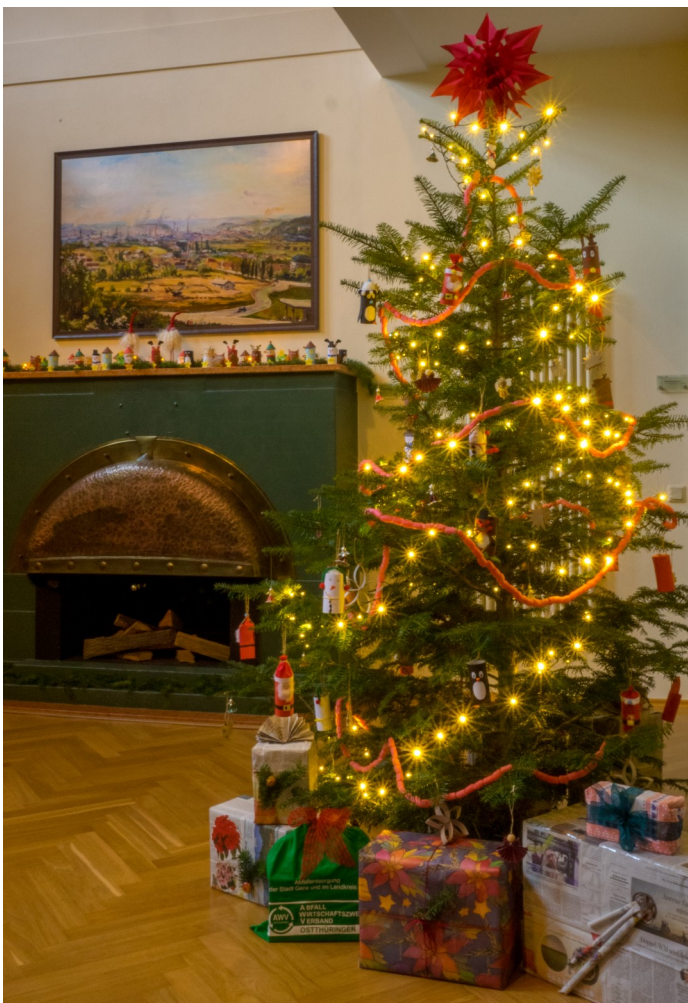
Eingangshalle der Villa Mazur - AWW Geschäftsstelle Gera

In der denkmalgeschützten Villa Mazur (Sitz des AWW Ostthüringen) herrscht eine weihnachtliche Atmosphäre und der Zweckverband blickt auf ein ereignisreiches Jahr 2025 zurück.